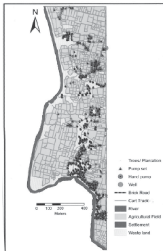
Fig.3 Land use of study area