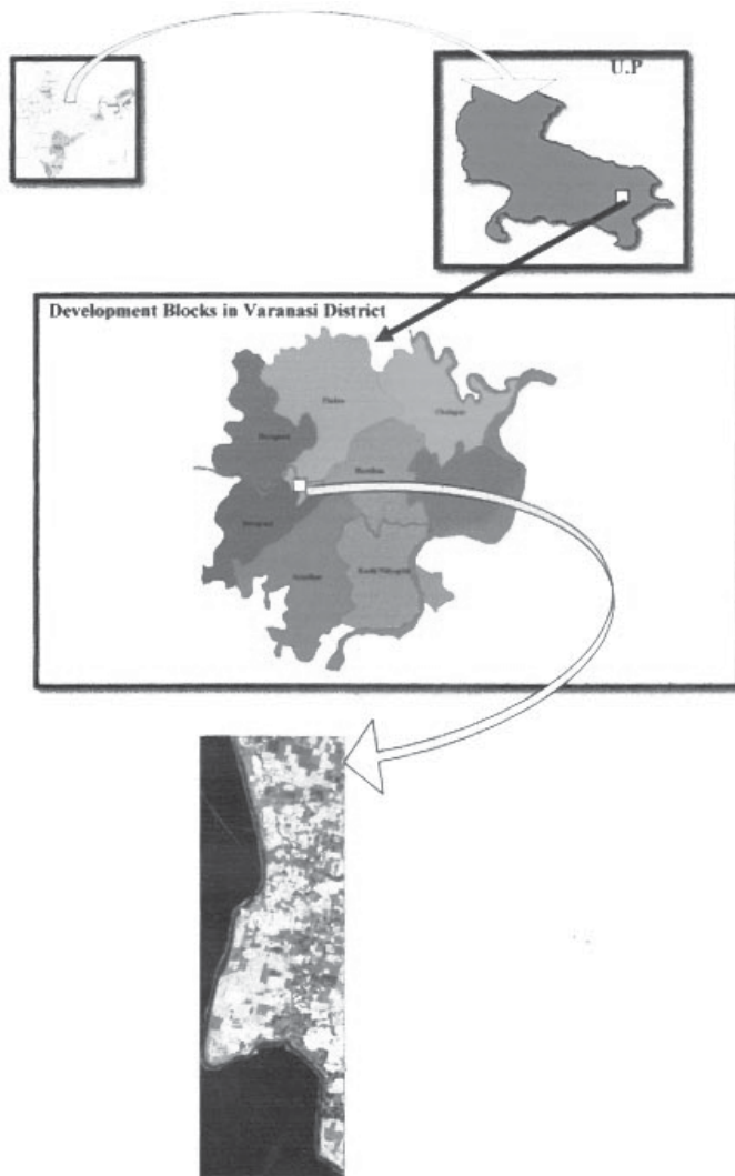
Fig. Location map of the study area as view on IKONOS data