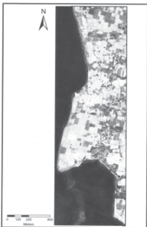
Fig.2 Satellite imagery of study area