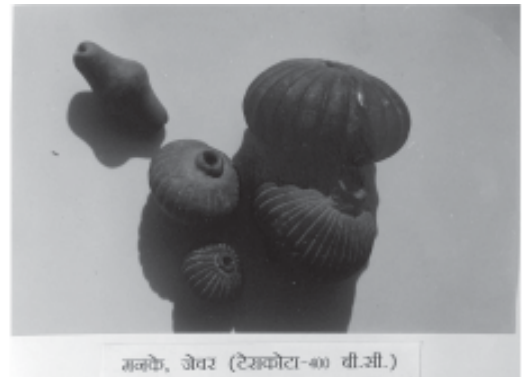
मनके, जेवर (टेम्पेटा-४०) वी.सी.)

मिट्टी के कई घाटीदार डिजाइन वाले गोला आकार के मनके चेचर से पाये गये हैं जिनमें कुछ चमकदार काले एवं कुछ लाल रंग के हैं इनके बीचो-बीच छिद्र किया हुआ है जिसे धागों में गुंथ कर सम्भवतः गले में पहना जाया जाता होगा, इसी तरह काले रंग में प्राप्त पकी मिट्टी की सुन्दर