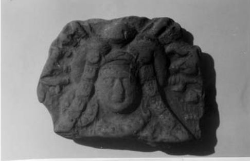
"शनी" शुंग, कुशान कालीन