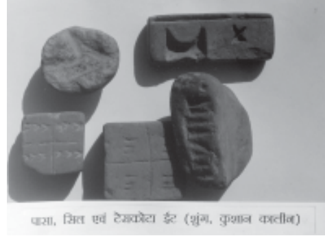
घसा, सित एवं टेम्पेटा ईट (शुंग, कुशान कालीन)

मोहनजोदड़ो हड़प्पा, तक्षशिला, वैशाली, पाटलीपुत्र, मंगलगढ़, चिरांद एवं नालंदा की तरह चेचर से भी कई प्रकार की मिट्टी की मुहरें प्राप्त हुई है। ये गोल अंडाकार या चौकोर बनी है। जिनमें ब्रम्ही गुप्तकुटिल, प्राचीन नगरी एवं चीनी लिपियों में शिवदासस (शिवनासस्य) सागरमेतस (सागर-मृतस्य), केओनिकस (कनिष्कस्य), वधकस (वयकस्य), पविसनिकस, तारवलः धर्मपालितस्य, दंतक, बलक, गुरुमित्र आदि अंकित है। इन मुहरों में लेख के साथ अंकित स्वास्तिक, नंदीपद, शंख, मोर, नाग, हंस, लता-पुष्प आदि चिन्हों का अपना प्रतीकात्मक महत्व है। इन मुहरों को ई. सन् की पहली से दसवीं सदी तक निर्धारित किया गया है। इनका प्रयोग सक्षम पदाधिकारी, मठ-मंदिर तथा व्यापारिक संस्थान द्वारा किया जाता था। चेचर से प्राप्त चीनी लिपि में प्रतीक अंकित 'स्वर्गसेतु' का सम्बन्ध धार्मिक, 'वयकस' का सम्बन्ध व्यापारिक तथा शेष का सम्बन्ध प्रशासनिक लगता है।