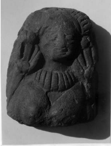
मातृ देवी-(मृण्मूर्ति, शुंग, कुषाण कालीन)

भारतीय मृण्मूर्तियों का जीवंत इतिहास हड़प्पा काल (2250-1750 ई.पू.) से आरंभ होता है। मोहनजोदड़ो एवं हड़प्पा से प्राप्त मृण्मूर्तियों ने यह प्रमाणित कर दिया है कि भारत में प्रायः साढ़े चार हजार वर्ष पूर्व ही मृण्मूर्तिकला विकसित हो चुकी थी, जो निःसन्देह हमारे सांस्कृतिक विकासक्रम का प्रतिनिधित्व करती है। इस काल-खंड की मृण्मूर्तियों की कुछ निजी विशिष्टताएं हैं। हाथ से बनी होने पर भी इनमें कई प्रकार के केशविन्यास, सिर के वस्त्र तथा आभूषणों की व्यंजना हुई है। इस युग की अधिकांश आकृतियाँ नग्न होती हुई भी अलंकारयुक्त हैं। ये अलंकार देहयष्टि बनने के बाद लगाये हैं। आंखों की पुतलियाँ भी बाद